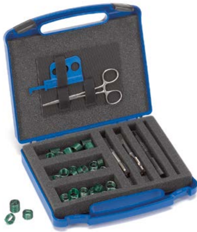
«Helicoil» Reparaturpackungen in metrischen Abmessungen für Sondergewinde