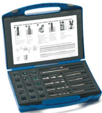
198-teilig «Helicoil» Reparatursortimente mit metrischen Gewindeeinsätzen