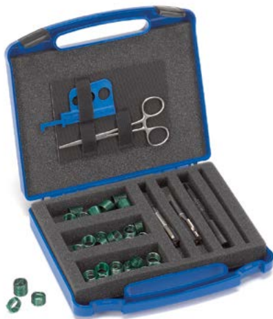
«Helicoil» Reparaturpackungen in metrischen Abmessungen für Sondergewinde