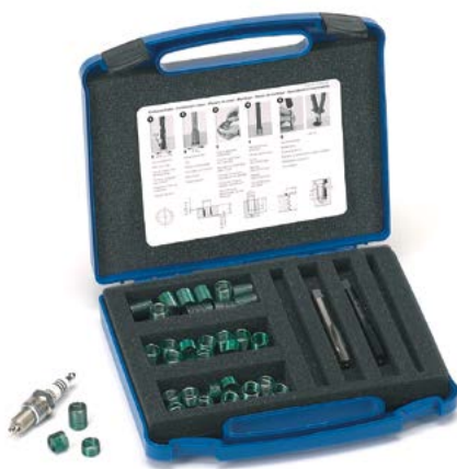
«Helicoil» Reparaturpackungen in metrischen Abmessungen für Sondergewinde