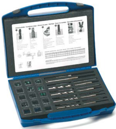
198-teilig «Helicoil» Reparatursortimente mit metrischen Gewindeeinsätzen